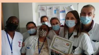
Implication XXL Gastro-entérologie

Les résultats ont permis d'établir un classement individuel et un classement par équipe. Deux services se sont distingués : - Implication XXL 2022 (plus grand nombre de participants) : la gastro-entérologie avec 35 participants , - Service d'or hygiène des mains 2022 (meilleure moyenne des participants) : la réanimation chirurgicale avec une moyenne de 15,5/20 .