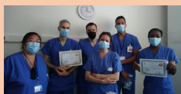
Service d'Or Réanimation Chirurgicale